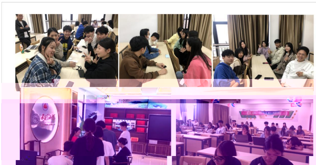
同学们在线下门店实训场景