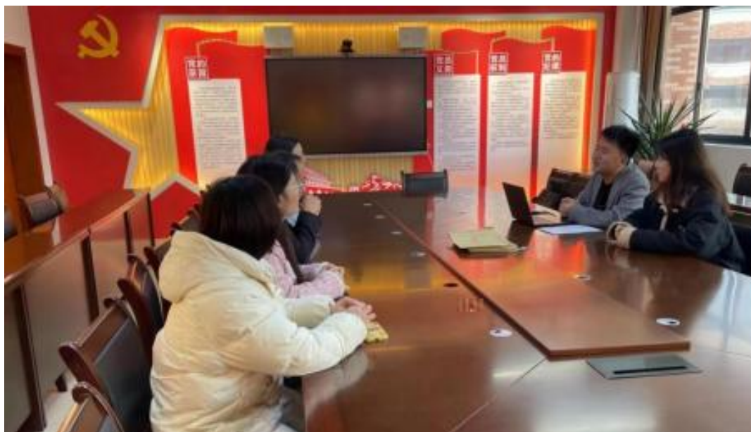
图 校企开展学术研讨项目交流会议

公 高度 队的 ，充分 到 和 的关 ，对 高 和 关 的 。此公 供 ，包 更 、 方法 及 导 发 程，并 持 丰富 的 家 过 、 会和 际案 ， 队 分 的 和 。 常 地 活动， 包 参加 会 、 等 ， 促 问 的 分 ， ， 并 的 队 ( )。