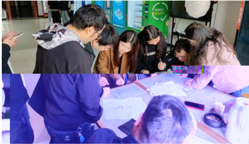
图 卓越团队建设共识营