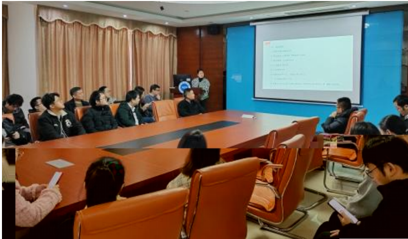
图 员工专业技能培训

，公 促 发 和 才 方 得 成 。 过 创 的 和 ， 不 动 公 的 持 成长， 工 供 的发 机会。 过 供多 化的 和发 ， “ 队 共 ” 等 活动 ( )， 帮 工 ( 技 和管 ； 并 的 和 规划， 工的 合 和 ， 包 导 发 计划、技 技 及 部 等， 地促 工的 方 发 。